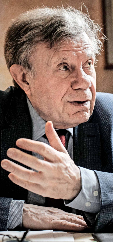
Roger Chartier es autor de "El mundo como representación" y "El orden de los libros".

Referente de la Escuela de los Annales, el historiador francés afirma que la cultura digital es un hito mayor que la invención del códex y de la imprenta, y advierte que pone en riesgo el estatuto del conocimiento. Sin embargo, cree que es posible, con educación, recuperar el sueño de una comunicación universal. El jueves, en Santiago, dictará la charla "Humanidades, humanismo, humanidad".