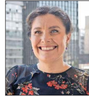
Gabriela Elgueta Subsecretaria de Vivienda y Urbanismo

Ingeniera en Construcción y militante de Renovación Nacional. Es la mujer más joven en ser designada senadora, cargo que detenta por la Región de Los Ríos, antes fue gobernadora de Valdivia entre 2018 y 2019. Este 2024 asumió como presidenta de la comisión de Vivienda y Urbanismo del Senado. Desde ahí, ha sido clave en los esfuerzos por enfrentar el déficit habitacional, además de acelerar los permisos de construcción. Uno de sus principales logros es la aprobación del proyecto de ley que simplifica los trámites administrativos desde el inicio de los proyectos hasta la entrega de las viviendas.