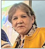
Marta Ercira Caro Directora del Servicio de Salud del Maule

Matrona, lleva 10 años como diputada. Actualmente preside la Cámara de Diputadas y Diputados. Cariola es la quinta mujer en ocupar el cargo, además de ser la más joven en esa posición, demostrando que vivir un embarazo "no nos imposibilita" para continuar nuestras labores, dice. Desde lo legislativo, ha tenido un rol activo en la rebaja laboral a 40 horas, la tarifa de invierno, Ley Gabriela, la rebaja a la tarifa del pasaje al adulto mayor, entre otras, todas normativas ya aprobadas y/o en vigencia. Otros proyectos de su autoría en tramitación son el de equidad salarial y el que elimina las preesentencias.