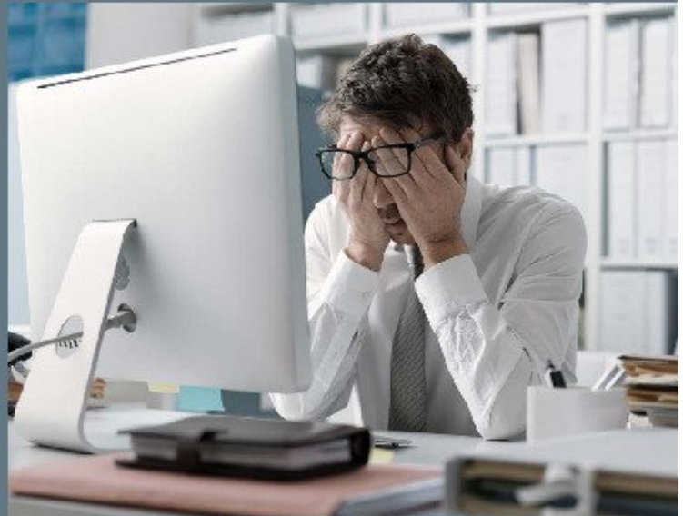
Cada vez son más las personas con errores de visión, debido a múltiples factores como el envejecimiento y el tiempo prolongado con una visión de cerca.

Aunque la pérdida de visión puede afectar a personas de todas las edades, la mayoría de las personas con discapacidad visual y ceguera superan los 50 años. A ello hay que añadir que cada vez son más las personas con errores de refracción, debido a múltiples factores como el envejecimiento y el tiempo prolongado a una visión de cerca.