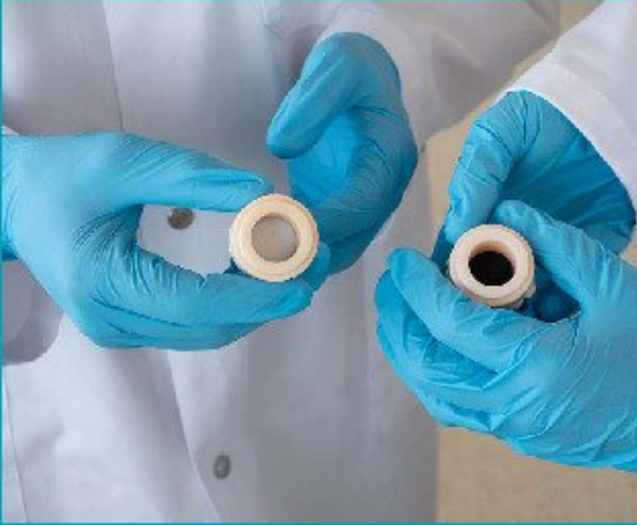
Investigadores mostrando distintos materiales utilizados en las baterías de sal experimentales.