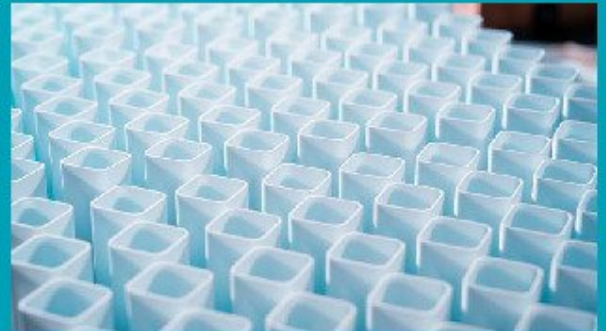
Piezas de baterías de sal producidas a escala industrial y disponibles en el mercado.

"Si se pueden producir de forma barata y en grandes cantidades, algún día podrían proporcionar electricidad no solo a las antenas de telefonía móvil, sino a zonas residenciales enteras" concluyen.