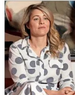
Melanie Joly estuvo de visita en Chile esta semana.

Abogado del renunciado militante socialista insiste en su "inocencia": "Lo voy a sostener en el tribunal de Garantía".