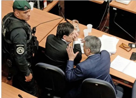
El exsubsecretario del Interior Manuel Monsalve, al oír los delitos que le atribuyen haber cometido contra una joven exsubordinada, entre la noche del 22 de septiembre y la mañana del día siguiente.

Audiencia se suspende hasta el martes, para que la defensa pueda revisar antecedentes. Exautoridad queda detenida en un cuartel de la PDI.