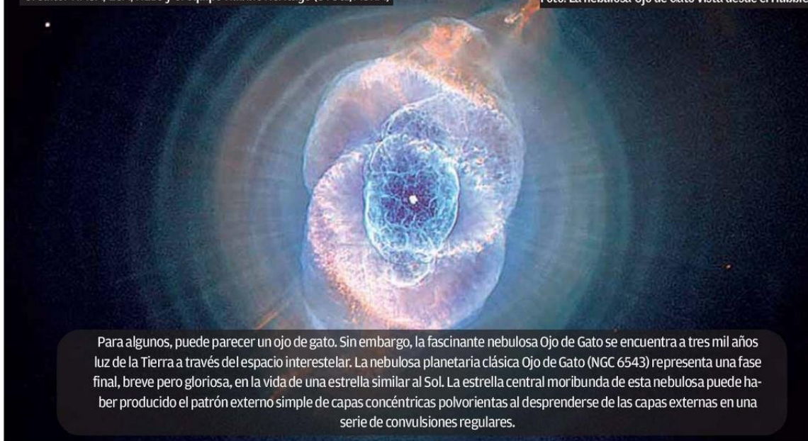
Foto: La nebulosa Ojo de Gato vista desde el Hubble

Para algunos, puede parecer un ojo de gato. Sin embargo, la fascinante nebulosa Ojo de Gato se encuentra a tres mil años luz de la Tierra a través del espacio interestelar. La nebulosa planetaria clásica Ojo de Gato (NGC 6543) representa una fase final, breve pero gloriosa, en la vida de una estrella similar al Sol. La estrella central moribunda de esta nebulosa puede haber producido el patrón externo simple de capas concéntricas polvorientas al desprenderse de las capas externas en una serie de convulsiones regulares.