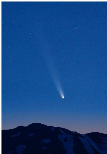
RECIENTEMENTE, SE VIO EN LOS CIELOS DE NUESTRO PAÍS EL COMETA C/2023 A3 TSUCHINSHAN-ATLAS, TAMBIÉN CONOCIDO COMO EL "COMETA DEL SIGLO".

que "las órbitas de los cometas están cambiando constantemente: sus orígenes están en el Sistema Solar exterior y tienen la propensión a ser altamente afectados por acercamientos relativos a los planetas mayores. Algunos son movidos a órbitas muy cercanas al Sol y se destruyen cuando se aproximan,