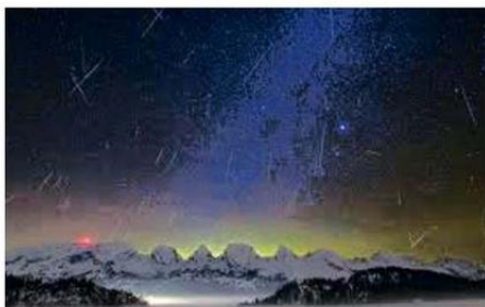
LAS LEÓNIDAS SON UNA LLUVIA DE ESTRELLAS FUGACES QUE SE PODRÁN OBSERVAR EN ESTOS DÍAS DE NOVIEMBRE.

-Un cometa es un cuerpo celeste: su núcleo, de un tamaño de pocos kilómetros, está constituido por hielo sólido de agua congelada y polvo. Los cometas forman parte del Sistema Solar, la mayoría de los cometas describen órbitas elípticas