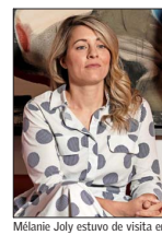
Melanie Joly estuvo de visita en Chile esta semana.

Abogado del renunciado militante socialista insiste en su "inocencia": "Lo voy a sostener en el tribunal de Garantía".