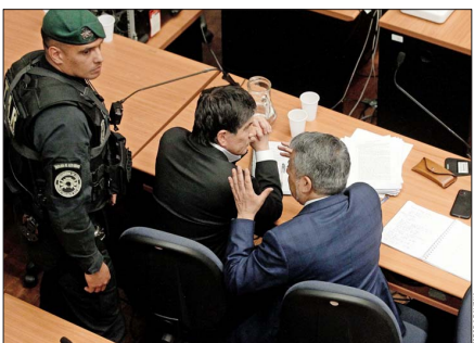
El exsubsecretario del Interior, Manuel Monsalve, al oír los delitos que le atribuyen haber cometido contra una joven exsubordinada, entre la noche del 22 de septiembre y la mañana del día siguiente.

Legisladores del oficialismo consideran "inexplicable" que asesores cercanos al dimitido personero aún se mantengan en el Ejecutivo.