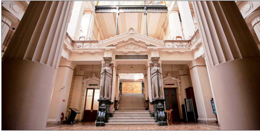
El estudio advierte que los niveles de confianza en los tribunales y en el sistema judicial son los que más se alejan del promedio de la OCDE.

Al mismo tiempo, en comparación con otros países de la organización, las personas en Chile están menos satisfechas con los servicios públicos, incluidas su confiabilidad y equidad (ver gráfico). Además, solo el 22% de la gente cree que el sistema político chileno permite que personas como ellas tengan voz en lo que hace el Gobierno, y el 35% considera probable tener oportunidades para expresar sus preocupaciones sobre asuntos locales. En esa línea, el estudio de la OCDE plantea: "Mejorar la percepción de la ciudadanía en sus interacciones cotidianas con las instituciones públicas ayudará a fortalecer el apoyo a las reformas gubernamentales y su-