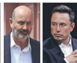
Federico Sturzenegger. Elon Musk.

El nuevo cargo económico en el que coinciden los propósitos de Trump y Milei