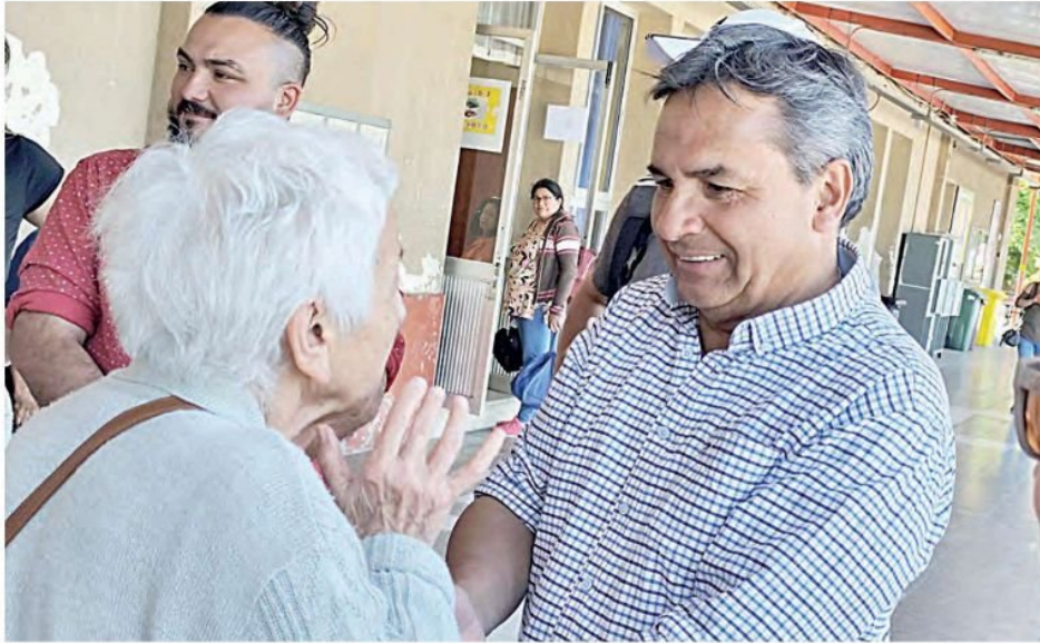
La cercanía con la comunidad sigue siendo el sello del alcalde electo.

nal, para proteger equipamientos críticos, es perfectamente posible incorporar militares. Pero para la acción policial en las calles sigo pensando que con el fortalecimiento de las policías y la organización comunitaria, más los recursos municipales, se puede todavía enfrentar la situación”.