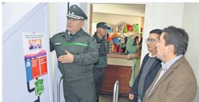
LAS AUTORIDADES EN EL ESCÁNER CORPORAL.