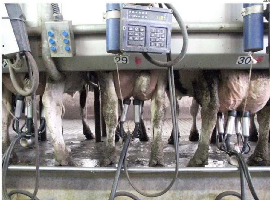
EL SECTOR LÁCTEO CHILENO CONTRIBUYE CON EL 1% DE LAS EXPORTACIONES DE ALIMENTOS Y BEBIDAS.

la "carbono neutralidad", es decir, que los Gases de Efecto Invernadero sean absorbidos por los bosques y las plantas.