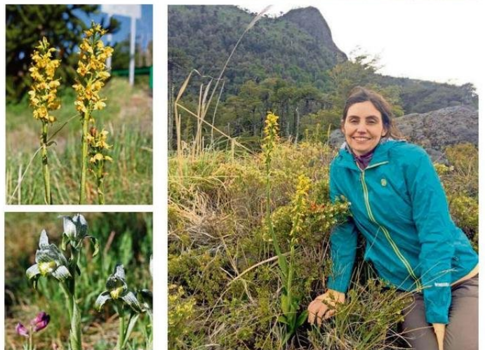
FOTOGRAFÍAS DEL CENTRO DE CONSERVACIÓN DE ORQUÍDEAS CHILENAS