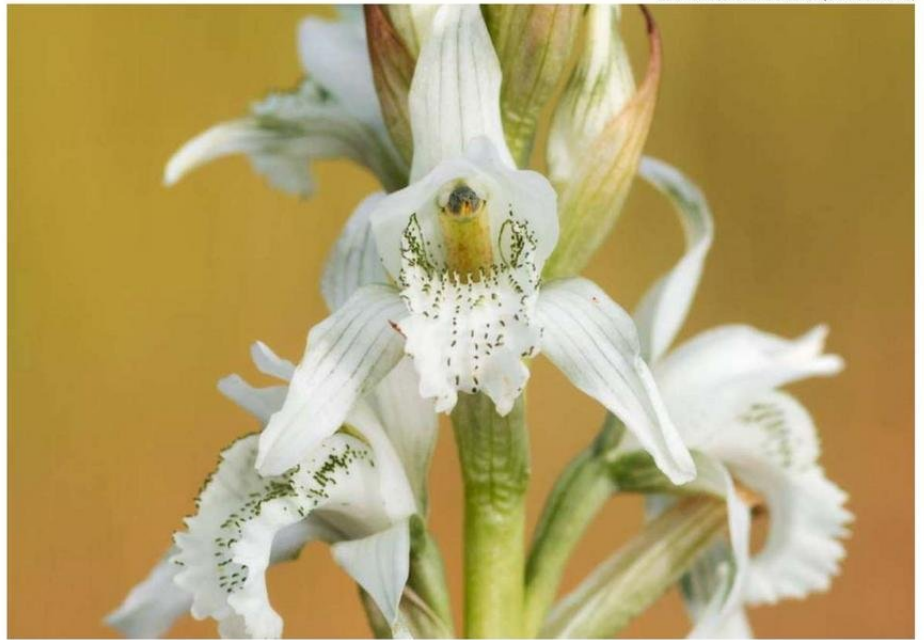
CENTRO DE CONSERVACIÓN DE ORQUÍDEAS CHILENAS

Esta investigación es financiada por el proyecto ANID InES I+D.C3