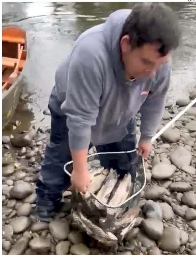
EN LA IMAGEN SE OBSERVA AL PESCADOR ILEGAL CON LA GRAN CANTIDAD DE TRUCHAS SACADAS DESDE EL RÍO.

Los dos hombres van en un bote de madera y en el video se jactan de la gran cantidad de peces que sacaron del Coihueco, los que incluso no caben en