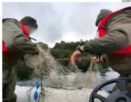
SERNAPESCA TRABAJA EN TERRENO PARA EVITAR LA PESCA FURTIVA.

por día de pesca es el máximo permitido por persona o bien alcanzar los 15 kilos (en algunos cauces es sólo 2) según indica la normativa vigente de pesca recreativa en Chile.