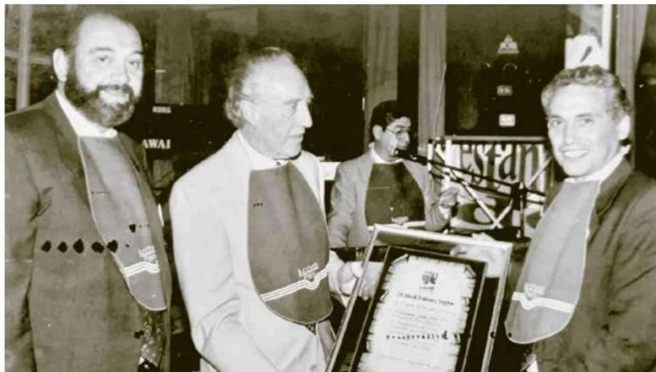
La Prensa recibió el reconocimiento de la Municipalidad de Curicó, por apoyar el programa "Curicó: 250 Años de Tradición y Progreso", en 1993.

Diario La Prensa, desde su primer número, un domingo 13 de noviembre de 1898, comienza a ser parte del desarrollo curicano, interpretando el espíritu de progreso de esta tierra. En su primera edición, estuvo por la construcción de un puerto militar en la costa curicana, Llico, idea del visionario Presidente Balmaceda, iniciativa que podría retomarse algún día.