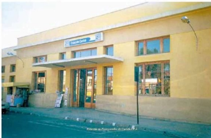
La comunidad, a través de este diario, exigió por años la reposición de la Estación de Ferrocarriles, hoy en plena construcción.