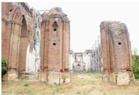
La reconstrucción de la Iglesia San Francisco sigue siendo la gran deuda con la historia curicana.

Diario La Prensa estuvo presente, en la inauguración del monumento a Luis Cruz Martínez, en octubre de 1912.