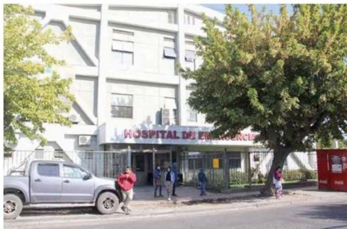
Un centro de salud en dependencias del Hospital de Emergencia, sigue siendo una necesidad apoyada por diario La Prensa.