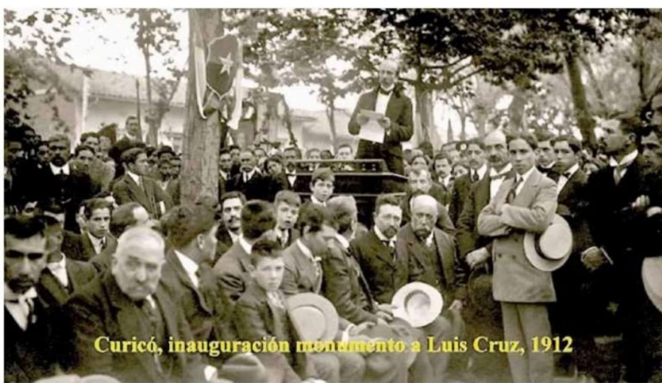
Curicó, inauguración monumento a Luis Cruz, 1912

Diario La Prensa ha entregado apoyo a los grandes eventos que se han realizado en Curicó, partiendo con la realización de las Fiesta de la Primavera del siglo XX, incentivando la participación comunitaria en la elección de la reina y presentación de carros alegóricos.