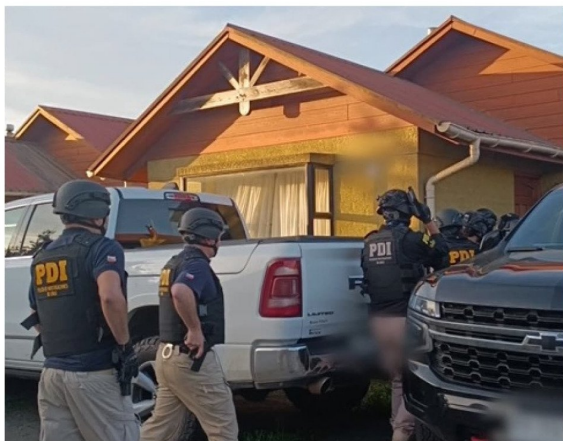
LA RED DELICTUAL MOVÍA 13 mil millones de pesos en transacciones ilícitas.

Todos los detenidos pasaron a audiencia de formalización este martes, la cual se extenderá hasta la jornada de este miércoles para determinar las medidas cautelares contra los imputados.