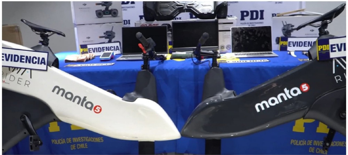
LA POLICÍA DE INVESTIGACIONES estuvo a cargo de los operativos en las tres provincias de la Región del Biobío.

ese momento teníamos información recopilada a través de los equipos de violencia rural. Desde entonces, nos enfocamos en esa información, abordando el fenómeno de la sustracción, recepción y acopio de madera para su venta a empresas forestales, que no compran si la documentación no está en regla".