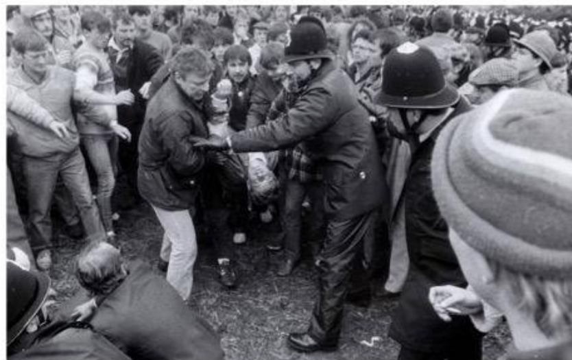
La policía se lleva un minero herido durante la llamada Batalla de Orgreave entre huelguistas y las fuerzas de seguridad en 1984.