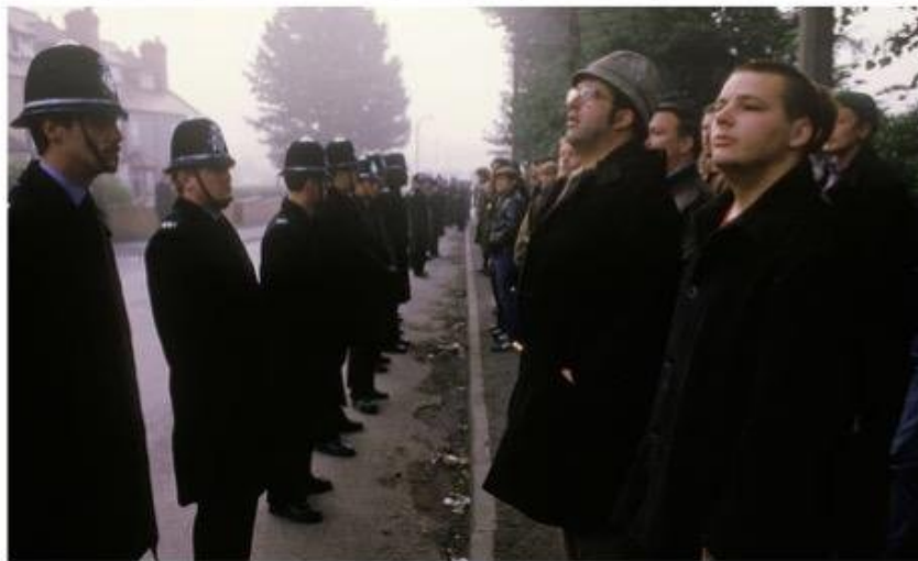
Policías cuidan que los huelguistas no bajen de la vereda a la calle.

La huelga fue declarada ilegal porque lo permitía un recurso, un atajo, un pretexto. Una legislación aprobada por los conservadores obligaba a los trabajadores a que aprobaran una huelga por votación, casi en referéndum, para que fuese legal. El NUM no votó la huelga, fue el voto de los mineros locales y regionales los que la aprobaron, pero no la central sindical por lo que la huelga tal vez era