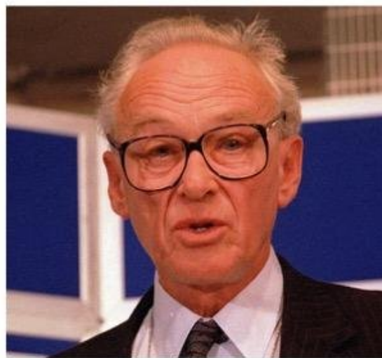
Nicholas Ridley, el ideólogo de las políticas de Thatcher sobre los sindicatos.