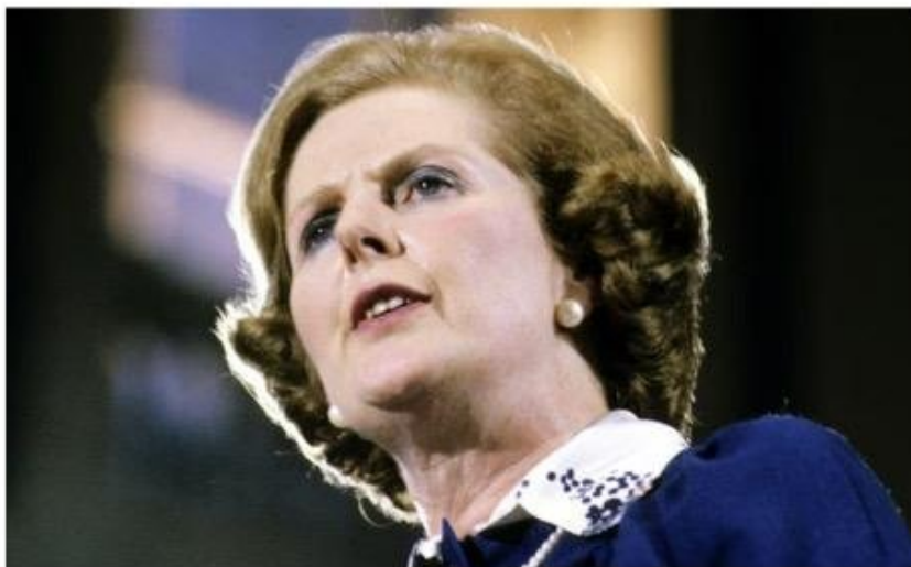
La líder conservadora Margaret Thatcher.

El movimiento huelguista de los mineros de hace cuatro décadas tiene una historia poco conocida que, tal vez, merezca