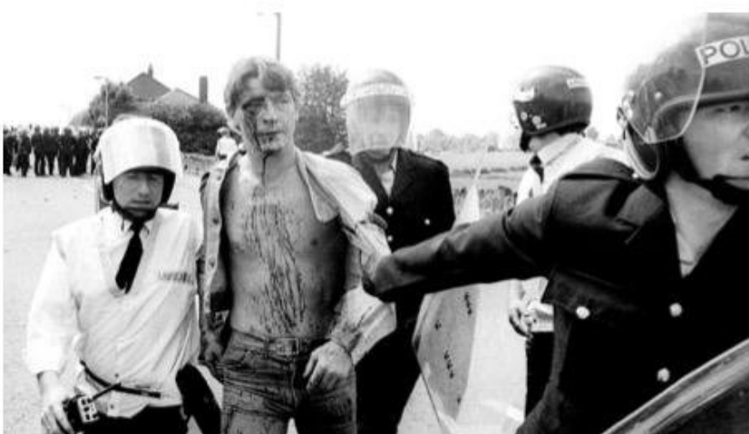
La "Batalla de Orgreave" en Sheffield, Gran Bretaña, durante la huelga minera de 1984.

tomada por estrecha mayoría. La central obrera tenía sus activos congelados y los mineros huelguistas dependían cada vez más de contribuciones voluntarias. Hubo una, de un millón de dólares, que fue anulada: provenía del futuro líder de la Unión Soviética, Mikhail Gorbachov, a quien advirtieron que su solidaridad con los mineros huelguistas podía traerle dificultades en el futuro entendimiento con los líderes europeos. La política del "Informe Ridley" aplicada por Thatcher hizo que las centrales eléctricas que atesoraban el carbón almacenado, permanecieran abiertas durante el invierno 1984-1985.