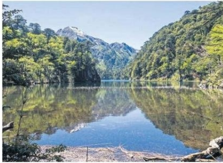
LOS LAGOS FUE LA ZONA QUE MÁS CRECIÓ EN EL PAÍS.

Las regiones que han tenido un crecimiento notable en estos viajes intrarregionales al cierre del primer semestre de 2024 incluyen Los Lagos, con un aumento del 20% en reservas, seguido de Co-