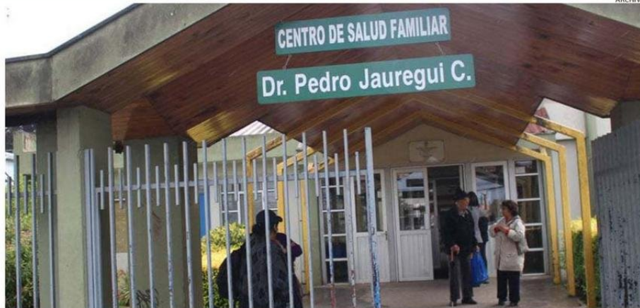
VECINOS ESPERAN QUE LA SALUD PRIMARIA MEJORE Y CAMBIE LA FORMA DE ENTREGAR HORAS PARA LA ATENCIÓN DE MÉDICOS EN LOS CESFAM.

"A los adultos mayores nos preocupa mucho este tema porque somos un grupo vulnerable, sin mayores recursos físicos para defendernos. Un robo, por pequeño que sea, es un