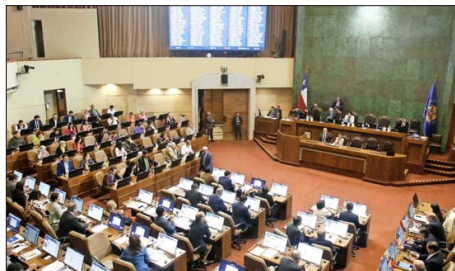
Durante toda esta semana se extenderá la votación del Presupuesto 2025 en la Sala de la Cámara de Diputados.

El ministro también hizo mención a la reducción del número de conscriptos en los últimos años, lo que ha afectado el flujo de estos hacia el escalafón de soldados profesionales. “Entre 2018 y 2022 la dotación de soldados conscriptos se redujo de 11 mil a 5 mil. Posteriormente, hubo un incremento en los últimos dos años, se ha aumentado en cerca de mil los soldados conscriptos. Al haber una reducción en el número de conscriptos, naturalmente hay un menor contingente de potenciales entrantes a la tropa profesional y eso hizo que prácticamente en todos los años, desde 2018 hasta ahora, siempre la do-