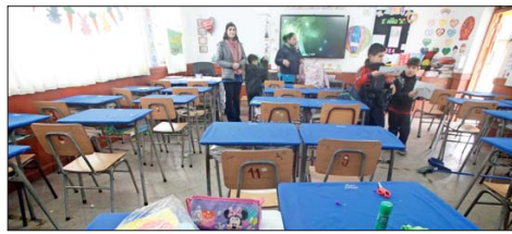
EXÁMENES LIBRES.— En la última década, casi se han cuadruplicado los alumnos que recurren a dicha fórmula. Un 23% de los desvinculados están inscritos.

cho de que aún estemos por encima de los niveles de deserción que teníamos antes de la pandemia, evidencia que las políticas implementadas por el Mineduc son insuficientes para abordar el problema de fondo”.