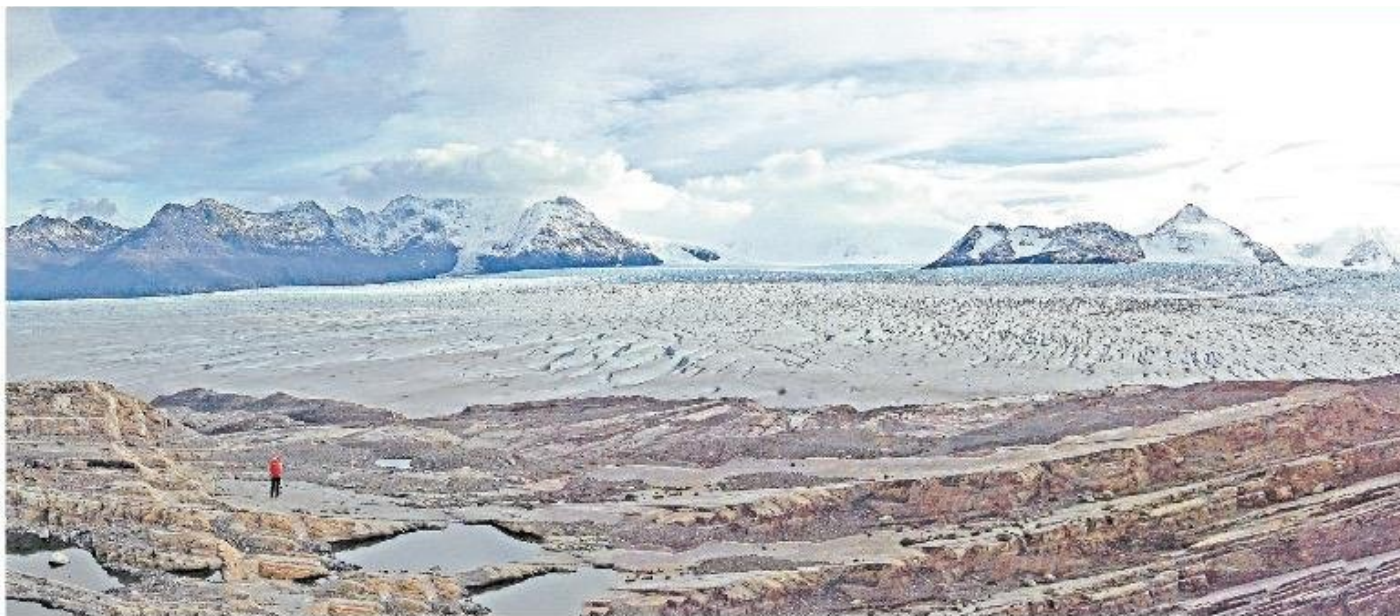
Vista del Glaciar Tyndall.