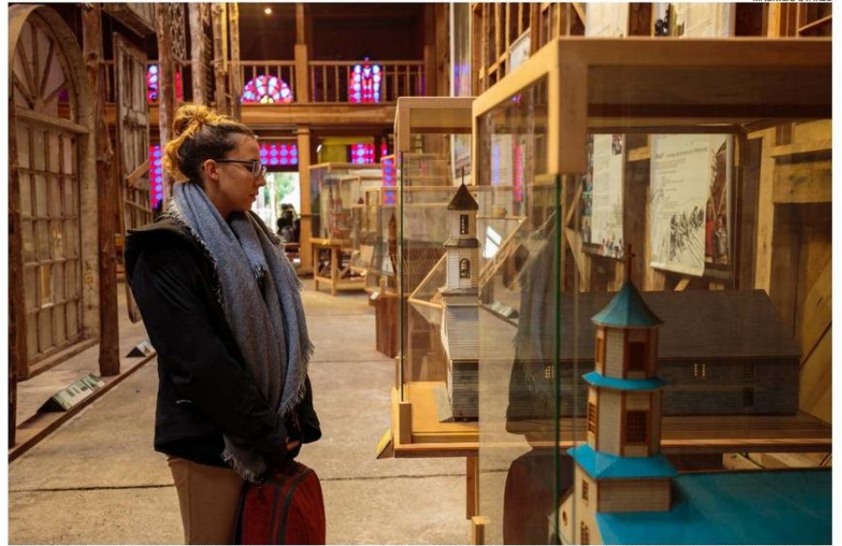
EL MUSEO DE LAS IGLESIAS DE CHILOÉ, EN ANCUD, ES DE GRAN INTERÉS PARA QUIENES DESEAN CONOCER MÁS SOBRE LA ARQUITECTURA CHILOTA.

Junto con ello, la dirigente mencionó que "ojalá que se pudiera vivir de eso todo el año, pero la temporada alta es siempre a fin de año y a principios del otro, por el tema del clima, pero yo creo que se debiera hacer mucha más promoción en