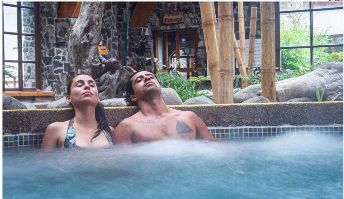
LAS TERMAS DE PUYEHUE, EN LA PROVINCIA DE OSORNO, OFECE RELAJO Y CONTACTO CON LA NATURALEZA PRÍSTINA DEL PARQUE NACIONAL PUYEHUE.

Asimismo, Chiloé y Patagonia Verde fueron otros de los destinos que experimentaron un incremento en comparación con el año pasado, pasando la provincia insular de un 28,8% en la misma fecha de 2023 a un 46,2% actual, subiendo 17,4 puntos. Y en el caso del territorio que considera a Cochamó, Hualaihué, Chaitén, Futaleufú y Palena, el alza fue