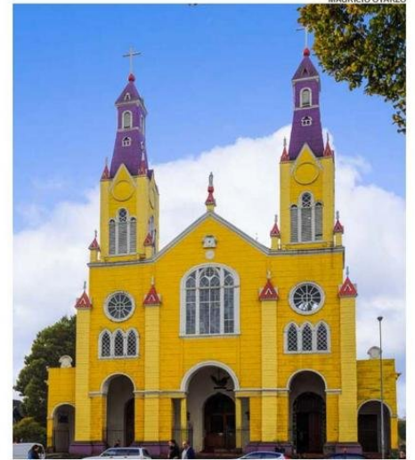
LA IGLESIA SAN FRANCISCO DE CASTRO ES UN ÍCONO DE CHILOÉ.

el resto de las regiones, en el norte de Chile para que esta estacionalidad no haga el turismo tan precario".