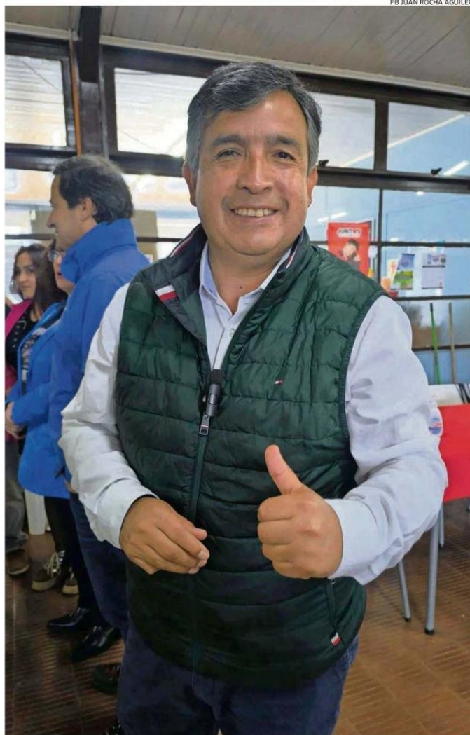
EL ALCALDE VOTÓ EN MALALHUE Y EN DICIEMBRE PRÓXIMO INICIARÁ SU NUEVO CICLO AL MANDO DE AL COMUNA.

“Por evidente que parezca, eso fue fundamental para comenzar a atender los problemas que hubo que solucionar. De todas maneras, lo que uno percibe, cuando decide optar a un cargo de mayor envergadura es el factor de la capacitación. Yo asistí a cursos y seminarios. Además, invertí en mi educación, fui a la universidad y saqué mi título de administrador público. En resumen, al primer período llegué con la experiencia suficiente y con las herramientas académicas necesarias, que me permitieron una visión mucho más acabada de lo que hay que hacer en materia de administra-