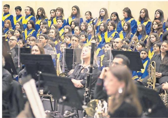
Diferentes piezas clásicas conformaron el repertorio del evento.

La actividad contó con la presencia de más de 500 asistentes, principalmente compuestos por apoderados y las familias de los estudiantes, socios de la corporación, funcionarios y autoridades de COEMCO, quienes se deleitaron con la presentación de