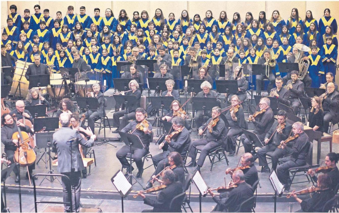
El coro junto a la orquesta UdeC deleitaron al público durante la gala.

En el marco de los 70 años de la corporación