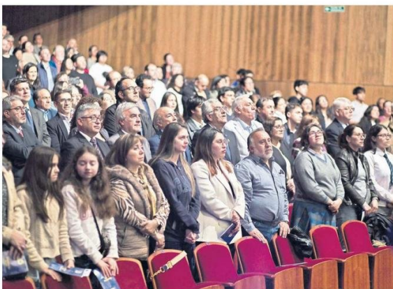
Los asistentes siguieron atentamente las interpretaciones.