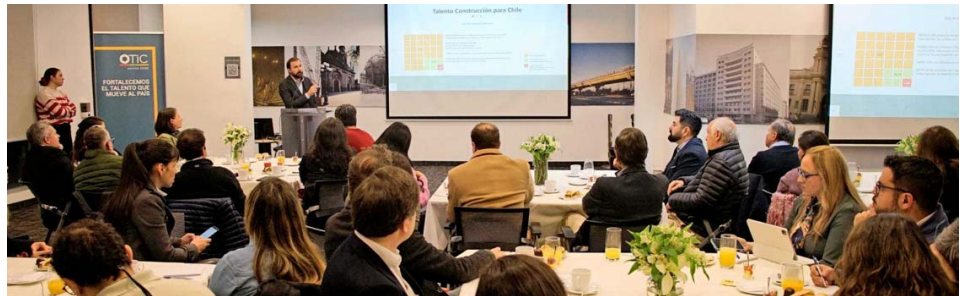
En octubre el OTIC de la Cámara Chilena de la Construcción (CChC) lanzó el Fondo de Innovación para el desarrollo del Talento (FIT) para la Construcción, destinado a impulsar la formación en áreas de innovación y tecnología, contribuyendo al desarrollo del capital humano necesario para un crecimiento sostenido.

La industria de la construcción es un área clave para el desarrollo de Chile. Este sector contribuye entre el 6% y 7% al PIB y emplea a aproximadamente 750 mil personas.