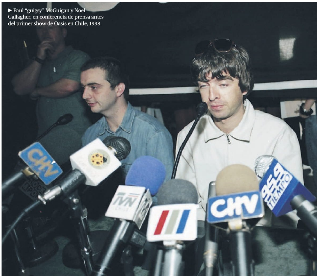
► Paul "guigsy" McGuigan y Noel Gallagher, en conferencia de prensa antes del primer show de Oasis en Chile, 1998.

presión que le dejó Noel tras conocerlo en esa experiencia de 2006. "Fue muy amable porque como que uno tiene, o sea, como que él públicamente tiene una imagen de cascarrabias y era todo lo contrario: era como muy caballero. Estaba todo el rato muy pendiente de '¿oye, se quieren servir algo?' y todo el rato fue puro hablar de música. En el camarín tenían puesto un disco de una banda que a nosotros nos gusta mucho que se llama The Kinks y era una sesión en la BBC".