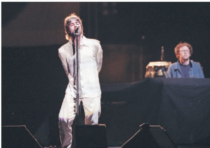
▲ Liam Gallagher, en el show de Oasis en San Carlos de Apoquindo, 1998.

el sábado 14). "No sé dónde está. Debe estar preso. Y si no, les aseguro que en seis meses sí que lo estará". Luego remató en su estilo: "Liam es un pollo loco".