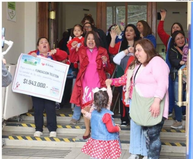
LOS COLEGIOS Y JARDINES COMENZARON LA PREVIA DE LA TELETÓN ENTREGANDO EL DINERO REUNIDO.

"Durante las últimas semanas, junto a los niños, apoderados y funcionarios, participamos en diversas actividades programadas, desde venta de completos y juguetes, hasta colectas para reunir el dinero que hoy entregamos como aporte a la Teletón. Este año la cifra nos deja muy conformes, porque superamos la del año pasado, que fue de 335 mil pesos y este año vinimos a dejar 678 mil pe-