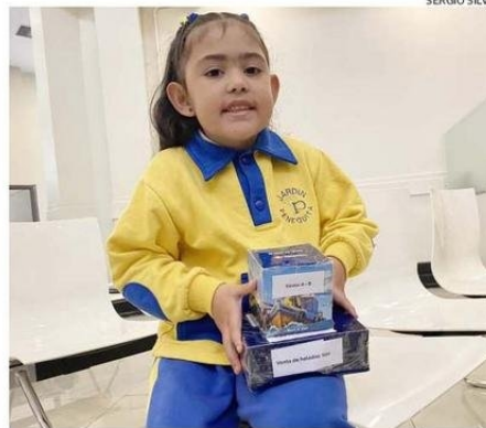
LOS NIÑOS SIEMPRE DAN LA NOTA ALENTADORA EN LA TELETÓN.

"Empezamos a hablar de la campaña de la 'lucutón', para incentivar a los compañeros y profesores a aportar, porque es algo lindo lo que hace la fundación. Es el momento de unión y aportar recursos para los niños que lo necesitan. Nosotros reunimos 441.160 pesos que juntamos en una semana", expresó.