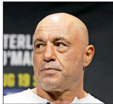
ROGAN conduce uno de los podcast más populares en EE.UU.

En una muestra del poder que ha sumado Musk con su cercanía al republicano, ayer se supo que el empresario participó de una llamada telefónica entre Trump y el