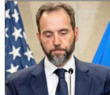
SMITH está a cargo del caso contra Trump por el asalto al Capitolio.

mula de Kamala Harris en la elección. Y si bien este puesto finalmente fue ocupado por el gobernador de Minnesota, Tim Walz, la exposición pública que implicó su participación en la campaña fortaleció su figura de cara a una potencial campaña presidencial en 2028, cuando termine el mandato de Trump.