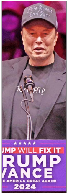
MUSK podría ocupar un puesto en el gabinete de Trump.

Uno de los grandes ganadores de la contienda fue el fundador de Tesla y dueño de SpaceX, Elon Musk, que invirtió unos 130 millones de dólares en ayudar a Trump para que volviera a la Casa Blanca. Esto, a través de su comité de acción, America PAC, y los sorteos de un millón de dólares, con los que incentivó el registro de votantes republicanos. Musk, el hombre más rico del mundo, se involucró en la campaña luego del primer intento de asesinato contra el ahora Presidente electo, en julio pasado, y se espera que ocupe un cargo en el próximo gobierno. Oficialmente, se postuló para liderar un aún inexistente Departamento de Eficiencia Gubernamental (su acrónimo en inglés es DOGE, el nombre de una criptomoneda) y ha abogado por reducir el presupuesto federal en “dos billones de dólares”. Además, según The New York Times, le pidió al mandatario electo contratar a varios de sus empleados en SpaceX en altos cargos del gobierno, incluyendo el Departamento de Defensa, y en ese marco, se espera que también impulse el sueño del multimillonario de llevar humanos a Marte.