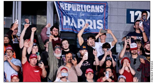
UN GRUPO de republicanos hizo campaña en apoyo a Harris.

El conductor de “The Joe Rogan Experience”, uno de los podcast más populares de Estados Unidos, entrevistó a Donald Trump en el último tramo de la campaña, durante más de tres horas y consiguió más de 47 millones de escuchas.