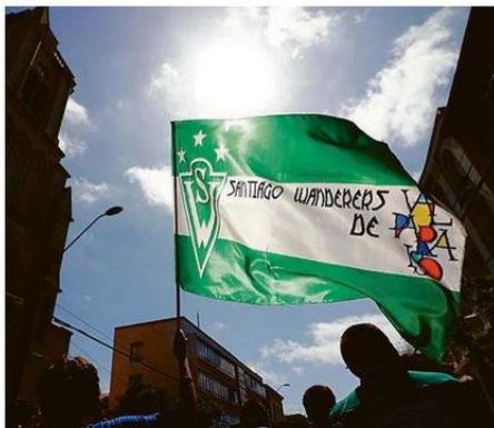
EL DIÁLOGO “VALPARAÍSO Y WANDERERS” ABORDA LA VINCULACIÓN ENTRE LA CIUDAD Y EL CLUB PIONERO DEL FÚTBOL PROFESIONAL.