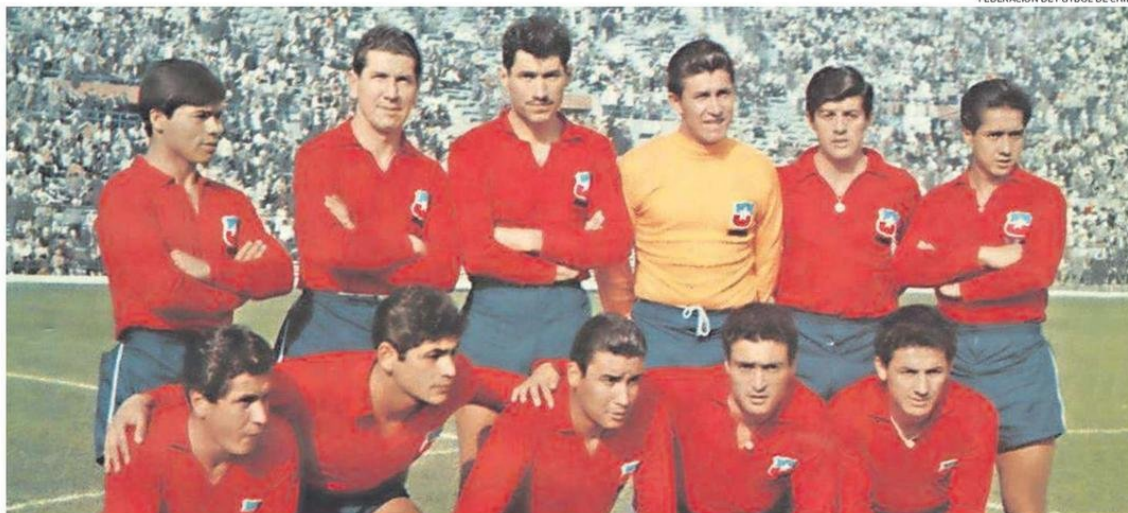
ROJAS FUE UN ICÓNICO JUGADOR ORIGINARIO DE ATACAMA, QUE QUEDÓ EN LA HISTORIA DEL FÚTBOL CHILENO GRACIAS A SU PARTICIPACIÓN EN EL MUNDIAL DE 1962 Y SUS DOS GOLES CLAVE.

Pero incluso ese gol se empequece ante el segundo tanto por el que es recordado Eladio Rojas. El 16 de junio, en el Estadio Nacional y ante más de 66 mil personas, se disputó el partido por el Tercer Lugar del Mundial de Fútbol de 1962 entre Chile y Yugoslavia, cuyo marcador se mantuvo 0 a 0 durante 89 minutos. Hasta que en el minuto 90, terminando el tiempo oficial del partido, un disparo desde fuera del área sentenció el encuentro. Eladio Rojas anotó el 1 a 0 para Chile y, con ello, le entregó la primera medalla mundialista al fútbol chileno y grabó su nombre