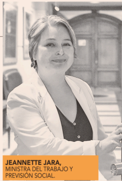
JEANNETTE JARA, MINISTRA DEL TRABAJO Y PREVISIÓN SOCIAL.

El Ejecutivo modificó su propuesta original desde 0%-6%, pasando por 4% a Seguro Social y 2% a capitali-