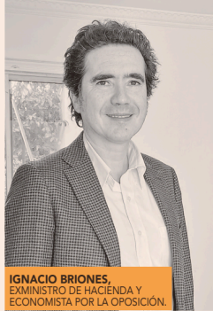
IGNACIO BRIONES, EXMINISTRO DE HACIENDA Y ECONOMISTA POR LA OPOSICIÓN.