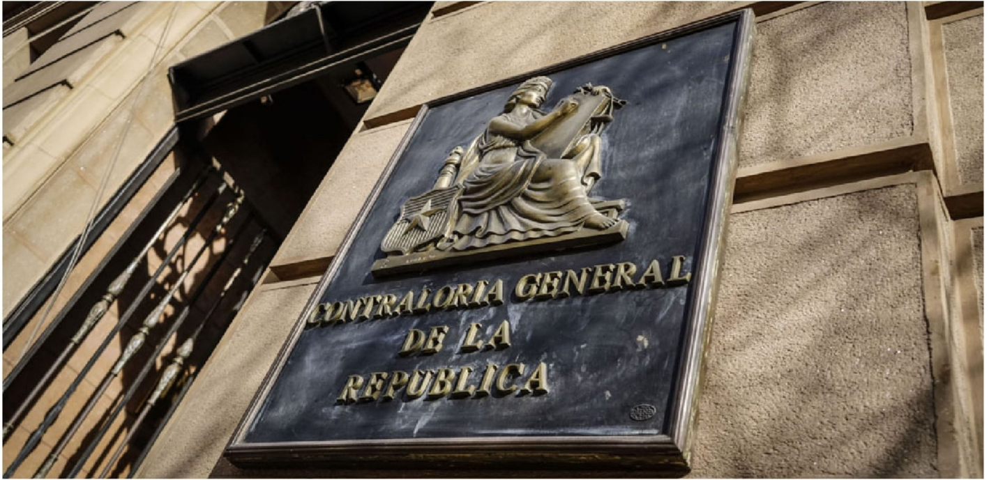
► La rapidez con la que actuó la contralora Pérez fue vista como una consolidación de su estilo.

ta, por lo que no se configura actuar ilegal o arbitrario si la desvinculación se produce antes de ese periodo.