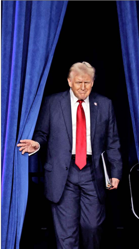
AL PRESIDENTE ELECTO Trump también le favorece una mayoría conservadora en la Corte Suprema.

El Presidente electo apuntará así a avanzar sin obstáculos en temas como su promesa de reanudar la mayor deportación de migrantes indocumentados en la