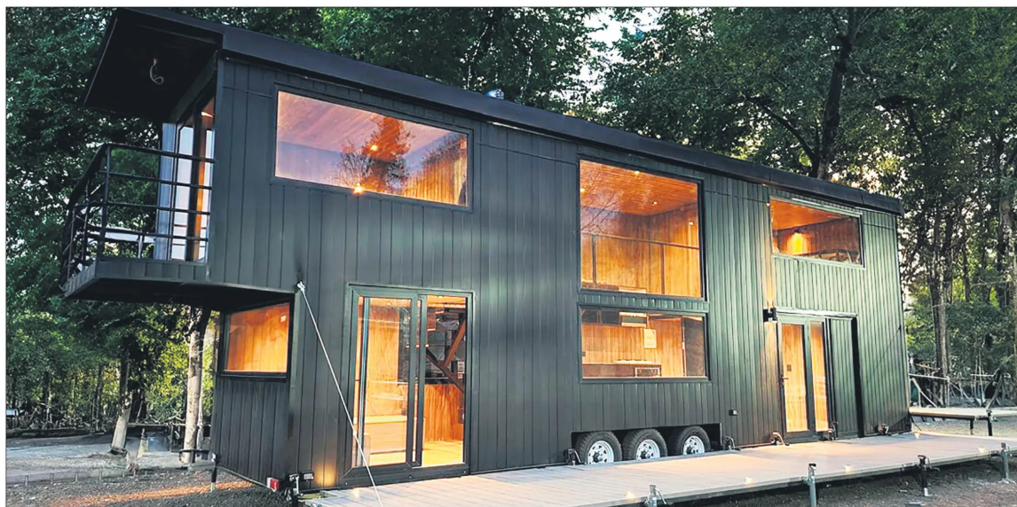
Los propietarios tienen derecho a usar el lodge seis semanas al año.