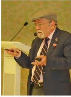
Con la participación estelar del astrofísico José Maza, el Hospital Regional Franco Ravera Zunino fue el escenario de la Segunda Jornada de Investigación en Salud.