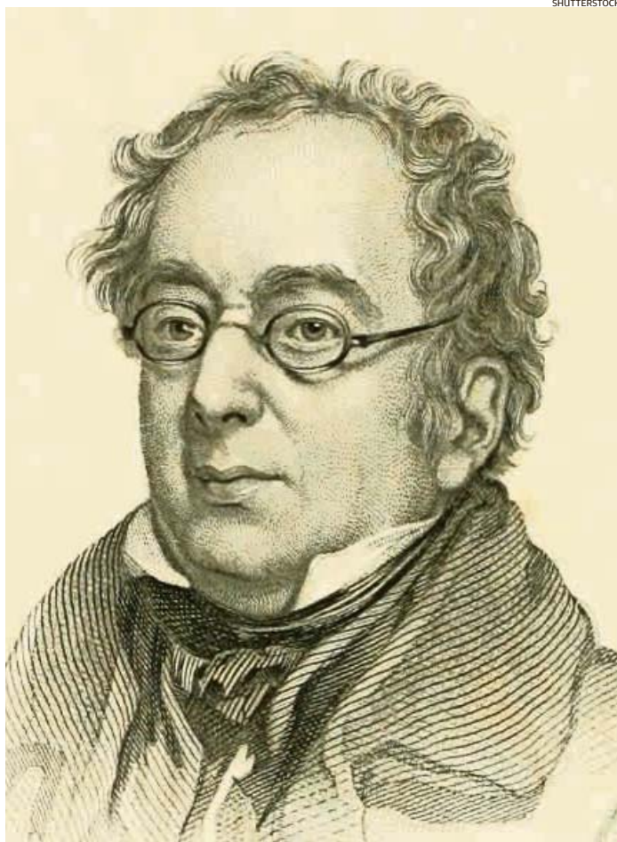
ISAAC DISRAELI PUBLICÓ “CURIOSIDADES DE LA LITERATURA” EN CUATRO TOMOS, ENTRE 1791 Y 1823.