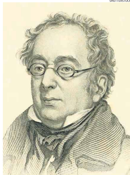
ISAAC DISRAELI PUBLICÓ “CURIOSIDADES DE LA LITERATURA” EN CUATRO TOMOS, ENTRE 1791 Y 1823.

—Yo estaba en Inglaterra y fue muy curioso, porque este era el autor más leído, más popular, una suerte de (Enrique) Lafourcade con “Palomita Blanca”, porque él hacía, lo que se llama en la tradición francesa, misceláneas. Entonces, los procesos de alfabetización que en Inglaterra fueron más rápidos por el protestantismo, al igual que en Alemania, a fines del siglo XVIII, principios del XIX, donde Disraeli escribió mientras la gente se estaba alfabetizando y quería captar cultura rápidamente, donde