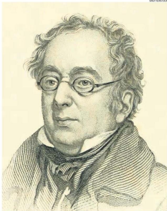
ISAAC DISRAELI PUBLICÓ “CURIOSIDADES DE LA LITERATURA” EN CUATRO TOMOS, ENTRE 1791 Y 1823.

cuatro volúmenes publicados entre 1791 y 1823, aunque la edición chilena está tomada del primer tomo, así que “esto puede que siga”, ríe González, junto con agregar que el autor “describe distintos aspectos de los clásicos, la cultura escrita, también como un pedagogo, a través de su propia opinión, ácida, mordaz y humorística, con la que va entrando en las masas lectoras inglesas con un lenguaje más llano, por eso fue tan popular”.