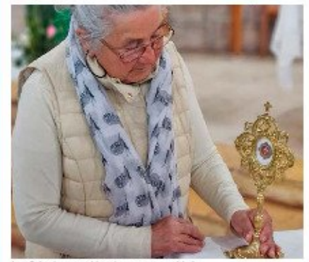
Los fieles han considerado una oportunidad única poder venerar la reliquia.

Esta linda experiencia de fe será vivida también por los jóvenes, pues la reliquia fue llevada a la Peregrinación Juvenil de Puquillay que se realizó el 2 de noviembre. Luego seguirá hacia el Decanato de Santos Apóstoles.