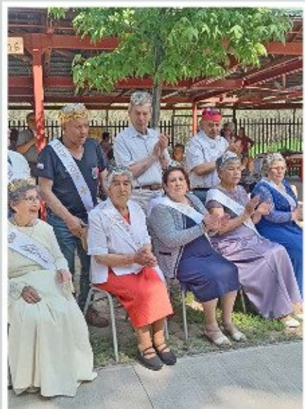
Entre las actividades realizadas hubo una elección de reina y rey.