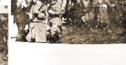
Secuencia donde se observa a los rendidos de la Universidad, instantes de ingresar al edificio del Seguro Obrero, donde horas más tarde serían ultimados.