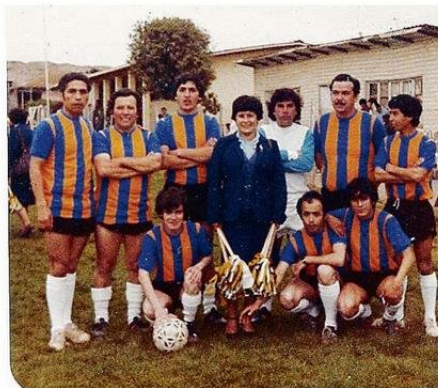
A LA IZQUIERDA, JUNTO A UN EQUIPO DE COMPAÑEROS MUNICIPALES.