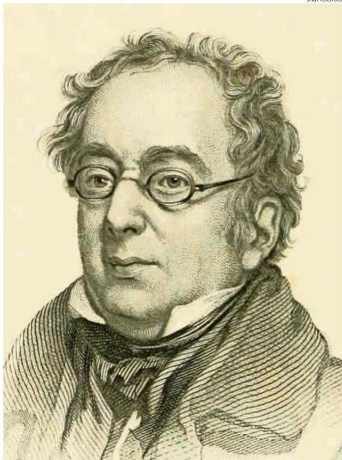
ISAAC DISRAELI PUBLICÓ “CURIOSIDADES DE LA LITERATURA” EN CUATRO TOMOS, ENTRE 1791 Y 1823.