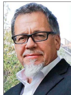
El senador Ricardo Lagos Weber ya cuenta con experiencia como vocero.