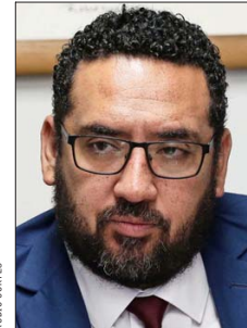
Ministro de Educación, Nicolás Cataldo.