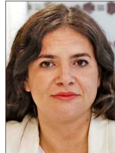
Ministra de la Mujer y la Equidad de Género, Antonia Orellana.