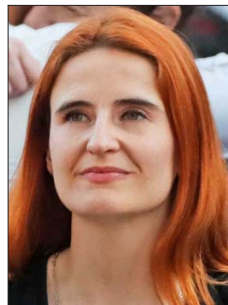
La alcaldesa de Ñuñoa, Emilia Ríos, no logró la reelección.