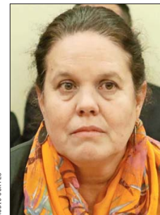
La ministra de Defensa, Maya Fernández, podría ir por un cupo en el Senado.

yo y no me veo en el Gabinete". Y añade que espera que los cambios que se realicen involucren a "políticos con experiencia".