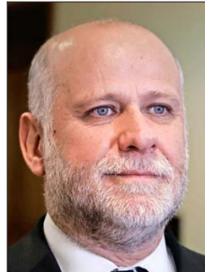
Ministro Segpres, Álvaro Elizalde.