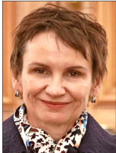
Ministra del Interior, Carolina Tohá.

Al interior de dicho partido, además, se habría considerado al senador José Miguel Insulza, quien ya fue ministro del Interior durante el gobierno del ex-presidente Ricardo Lagos. No obstante, ante una eventual oferta, el parlamentario asevera que está "contento en el Senado