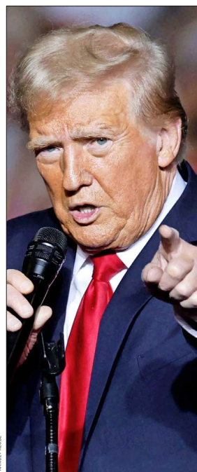
TRUMP estuvo en un acto electoral en Wisconsin el viernes.

Donald Trump es el primer político en EE.UU. en décadas que ha llegado al más alto cargo posible impulsando ese mensaje", acota el académico y coautor de "American Affective Polarization in Comparative Perspective", "Punto número uno (de las razones de la polarización) es que, y es algo obvio, Donald Trump es el figura política más polarizante de nuestras vidas", añade.