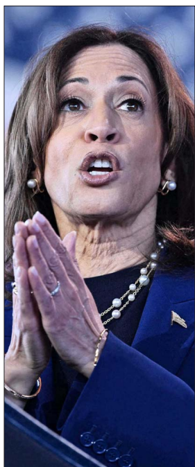
HARRIS visitará Michigan hoy, uno de los estados clave.

Hay evidencia, dice Adams, en estudios en varias democracias, de que el mensaje de los movimientos populistas de que el sistema es corrupto hace que sus seguidores sean más hostiles a los partidos tradicionales, que a su vez se indignan al ser descritos de esa manera, lo que termina incrementando el nivel de malestar, en una suerte de círculo vicioso. "Y