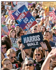
MANIFESTANTES protestan en la Plaza de la Libertad en Washington.

El movimiento de la Marcha de las Mujeres se lanzó en 2017, el día de la toma de posesión de Trump, cuando más de un millón de mujeres acudieron a la capital estadounidense para manifestarse en su contra, y resultó en uno de los eventos masivos más grandes en la historia del Distrito de Columbia.