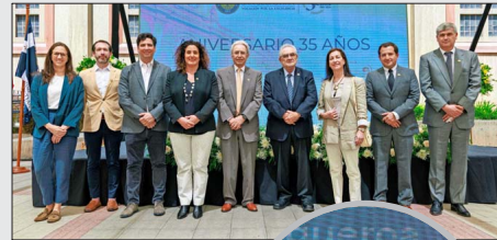
La USS es una comunidad formada por más de 6.000 académicos, 3.000 colaboradores, 50 mil estudiantes en todos sus programas, además de 30 mil egresados. Posee nueve facultades en distintas áreas del conocimiento: Psicología y Humanidades; Educación; Ciencias para el Cuidado de la Salud; Medicina y Ciencia; Derecho y Ciencias Sociales; Ingeniería, Arquitectura y Diseño; Economía y Gobierno; Ciencias de la Naturaleza; Odontología y Ciencias de la Rehabilitación.