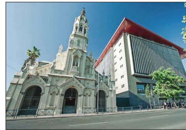
El campus Bellavista está ubicado en Recoleta.