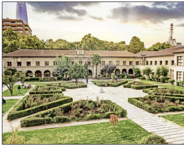
Campus Los Leones, en Santiago, edificio que constituye patrimonio cultural e histórico de la comuna de Providencia.