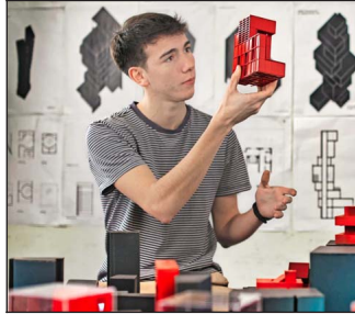
Durante su formación, estudiantes de arquitectura trabajan en proyectos que contribuyen a preservar y recuperar el espacio público, la puesta en valor del patrimonio y la conexión inclusiva con la naturaleza.

La USS establece una alianza con el Bioparque Buin zoo, donde funciona el hospital de medicina veterinaria. Esta actividad se complementa con el trabajo que realizan los Centros de Rehabilitación de Fauna Silvestre (Cerefas) que están presentes en las sedes de Concepción y De la Patagonia. Se estima que, desde sus aperturas, en 2002 y 2014 respectivamente, han rehabilitado a más de 3 mil ejemplares.