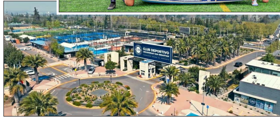
Nace el Club Deportivo USS con el propósito de potenciar la actividad física y la vida saludable, además de contribuir a la formación de nuevas generaciones de deportistas en distintas disciplinas. Además, en estas instalaciones se habilitó el Laboratorio de Fisiología y Biomecánica del Ejercicio de Alta Tecnología y el Centro de Salud del Deporte.