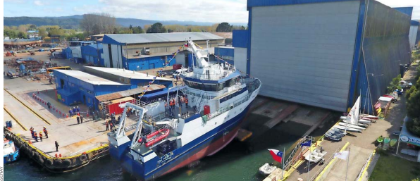
ASENNAV ha estado marcada por el impacto positivo que ha generado entre las comunidades en que se desenvuelve.