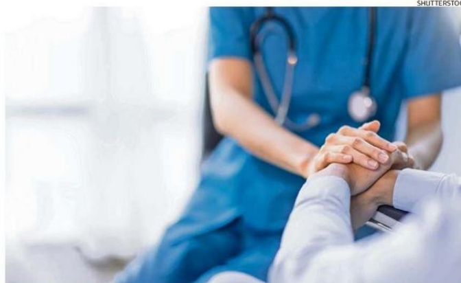
DORMIR LO SUFICIENTE DEBERÍA SER PARTE DEL TRATAMIENTO MÉDICO DE RECUPERACIÓN.

Los investigadores utilizaron primero modelos de ratón para descubrir este fenómeno; indujeron infartos en la mitad de los ratones y realizaron análisis celulares y de imágenes de alta resolución, además de utilizar dispositivos electroencefalográficos inalámbricos implantables para registrar las señales eléctricas de sus cerebros y analizar los patrones de sueño.