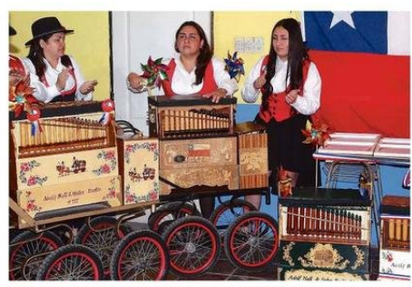
EL OFICIO DE ORGANILLERO NO ES PATRIMONIO MASCULINO.

-Creo que hay más de un periodo significativo, por ejemplo: en los años 70 u 80 del siglo pasado, los organilleros-chinchineros, mantenían una gran competencia en las plazas y festividades, donde la gente hacía grandes ruedas para poder disfrutar de su performance, eso se ha perdido a raíz de los grandes centros comerciales, que es en donde se concentra la mayor cantidad de gente. Pero en la ac-