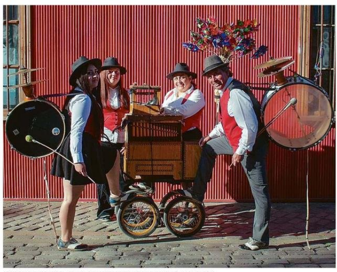
ORGANILLEROS Y CHINCHINEROS SOBREVIVIERON A LA PANDEMIA.

-Hace muy poco tiempo se terminó un estudio al